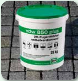
Fläche rückstandsfrei reinigen