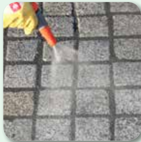
mit Wassersprühstrahl ...