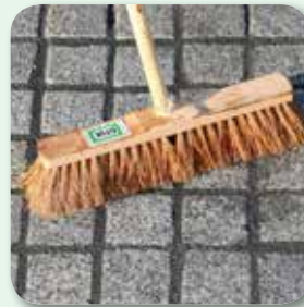
... und feuchtem Besen abreinigen